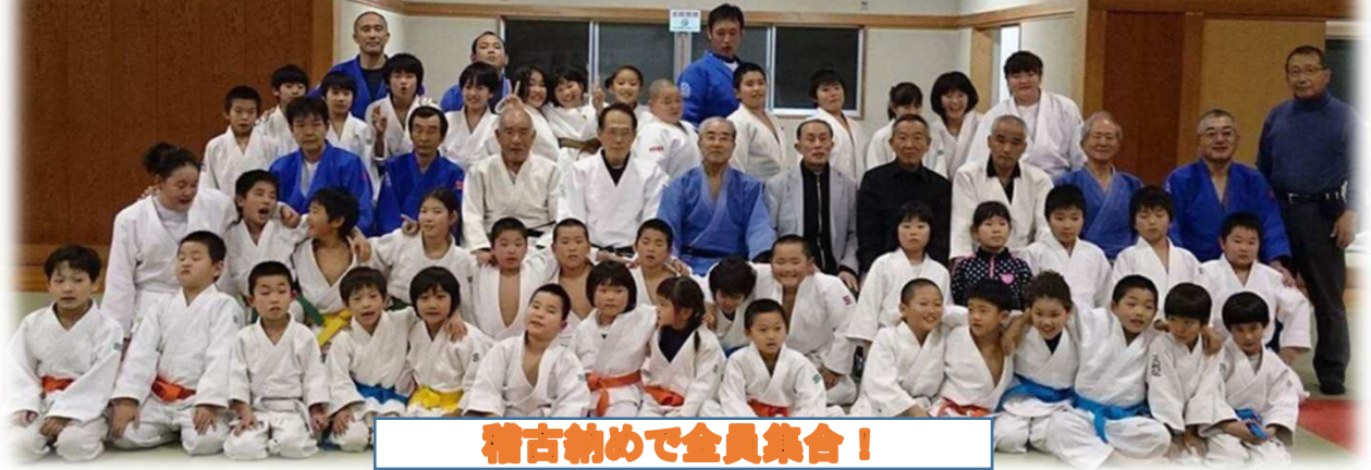
稽古納めで全員集合!